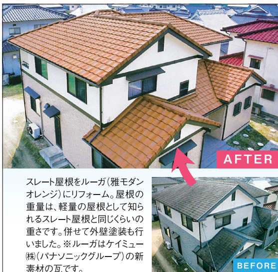
スレート屋根をルーガ(雅モダンオレンジ)にリフォーム。屋根の重量は、軽量の屋根として知られるスレート屋根と同じくらいの重さです。併せて外壁塗装も行いました。※ルーガはケイミュー(株)(パナソニックグループ)の新素材の瓦です。