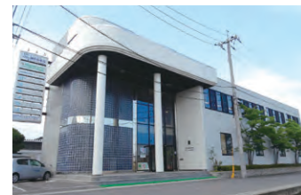
植田板金店社屋。弊社はルーガのリフォーム実績で、2016年中四国ナンバーワン(*)を獲得しています。

キャンペーン」を実施中(それぞれの月に着工する方に限ります)。工事を依頼される際には、1社だけでなく2社、3社見積もりを取ってみることをお勧めします。価格だけでなく、提案力や技術力、実績、施工後の保証なども検討し、信頼できる業者を選んでください。