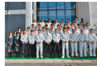
現場の経験や日々の勉強から習得した施工技術は、どこにも負けない自信があります。