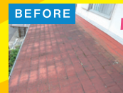
スレート瓦からルーガ鉄平にふき替え。重量はそのままだけに、見た目の高級感と耐久性が増しました。